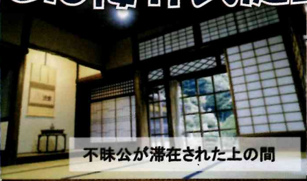
不味公が滞在された上の間