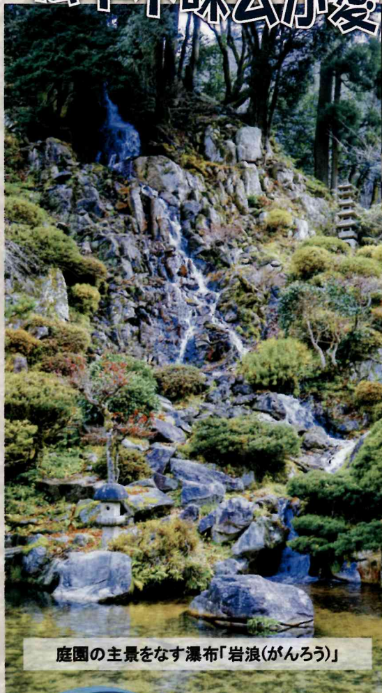
庭園の主景をなす瀑布「岩浪(がんろう)」